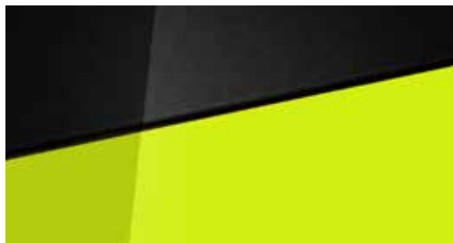
Lucid Lime Metallic + € 795 Lucid Lime Metallic Two-tone Phantom Black + € 995